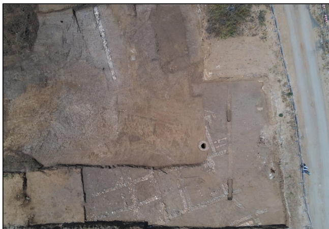
Fig. 2 - Pomezia (Rm) - Via Pratica di Mare 45. Vedute zenitale del complesso rustico

Il sito si colloca nel territorio dell'antico Latium Vetus , in prossimità dell'area dell'antica Lavinium , città di primaria importanza nella tradizione storica e mitica del Lazio arcaico. In età romana l'area fu interessata da una diffusa occupazione rurale con complessi abitativo-produttivi collegati alla rete viaria che metteva in comunicazione la costa tirrenica con Roma e i Colli Albani. Numerosi confronti provengono da contesti analoghi individuati nel territorio di Pomezia e della Tenuta della Cancelliera, caratterizzati da strutture rustiche con funzioni residenziali e agricole attive tra l'età repubblicana e la prima età imperiale.