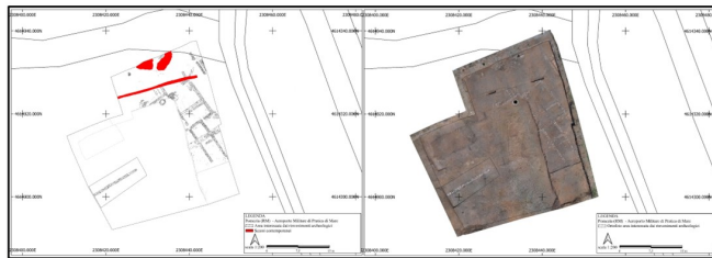
Fig. 1 - Pomezia (Rm) - Via Pratica di Mare 45. Planimetria georeferenziata e ortofoto del complesso rustico

Lo scavo archeologico condotto tra il mese di aprile e quello di giugno del 2025 presso l'aeroporto militare "Mario de Bernardi" di Pratica di Mare (Pomezia, Roma), nell'ambito dei lavori per la realizzazione della cittadella ISTAR, ha consentito di indagare parte di un complesso rustico di età romana. L'intervento ha riguardato un'area già precedentemente interessata da indagini archeologiche e parzialmente compromessa da attività moderne, tra cui operazioni di bonifica bellica e scassi per la posa in opera di sottoservizi (Fig. 1).