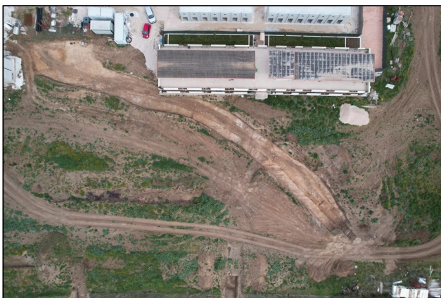
Fig. 1 - Ardea (Rm) - Via Damiano. Veduta zenitale del tracciato viario in tagliata

Le attività hanno interessato un'ampia fascia del pianoro tufaceo, permettendo di documentarne il percorso (con andamento N-S) per circa 90 m di lunghezza.