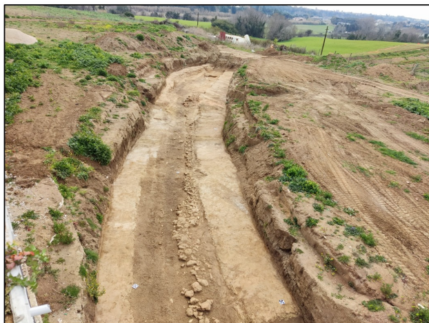
Fig. 2 - Ardea (Rm) - Via Damiano. Veduta del tracciato viario in tagliata da N a S

La fase più antica è costituita dalla sede stradale arcaica scavata nel substrato geologico, con una carreggiata larga circa 3 m; l'uso prolungato del percorso ha determinato il progressivo abbassamento di quota della sede carrabile all'interno della dorsale tufacea, generando un'invaso più ampio, pari a circa 5 m, entro il quale risultavano chiaramente leggibili i solchi carrai lungo i margini della carreggiata. I materiali ceramici associati al rinvenimento, tra cui frammenti di ceramica a vernice nera, consentono di collocare questa fase tra il V e il IV secolo a.C. In una fase successiva, probabilmente coincidente con un momento di temporaneo abbandono, tali incassi erano colmati da depositi sabbiosi naturali; durante l'età repubblicana, infatti, il tracciato fu probabilmente oggetto di interventi di manutenzione e regolarizzazione del piano di percorrenza. Una prima sistemazione è documentata da un battuto compatto di sabbia mista a pietrame minuto, accuratamente costipato, eseguito per colmare le irregolarità della sede originaria.