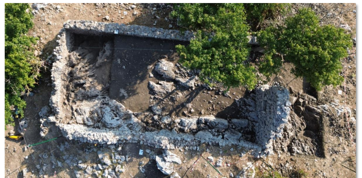
Fig. 3. Ortofoto S1, area 2 in fase di scavo.

Le indagini stratigrafiche nell'areale del sito fortificato hanno consentito di datare al XII secolo il processo di pietrificazione dell'abitato, coincidente - in questo caso - con la costruzione del villaggio fortificato, realizzato direttamente in pietra, non mostrando finora una fase edilizia in materiale deperibile. Nelle aree scavate, la sequenza stratigrafica sembrerebbe indicare il momento dell'abbandono del sito, avvenuto simultaneamente nella seconda metà del XIV secolo. L'analisi delle evidenze materiali sta inoltre offrendo nuovi elementi per delineare aspetti della società rurale e chiarire la natura e le trasformazioni degli assetti proprietari del castello.